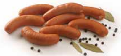
Saucisse Alsacienne Elzasser gekookte worstjes Elsesser wurst Alsacian cooked sausage