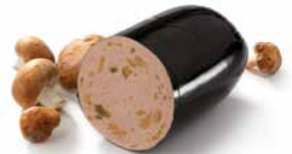
Saucisson aux champignons Champignonworst Champignonswurst Sausage with mushrooms