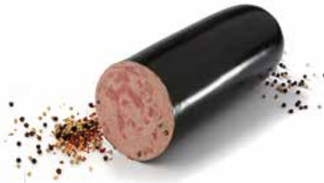
Saucisson de Paris Parijzerworst Bierschinken Paris sausage