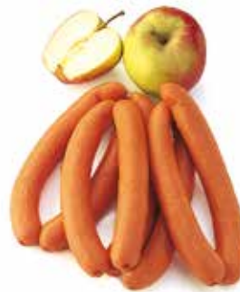
Saucisse de Francfort Frankfurter worst Würstchen Frankfurter Art Frankfort sausage