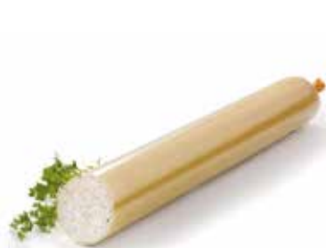
Saucisse persillé Peterselie worst Schinkenwurst mit Petersilie Sausage with parsley