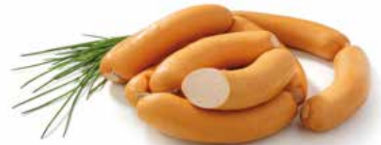
Cervelas de volaille Gevogelte cervelas Braune Cervelatwurst Polony