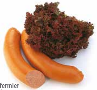
Saucisson fermier Lunchworst Lunchwurst Lunch sausage