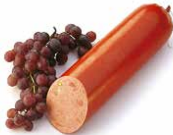
Saucisson de chasse Jachtworst Jagdwurst Hunting sausage