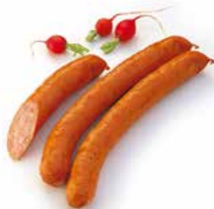
Saucisson polonais Poolse worst Kielbasawurst Kielbasa sausage