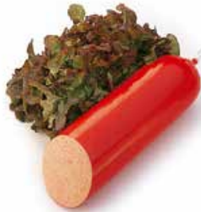
Saucisson de viande Rode boterhamworst Feine Schinkenwurst roter Darm Meat sausage red casing