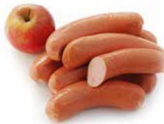
Cervelas bruns Bruine cervelas Braune Cervelatwurst Polony