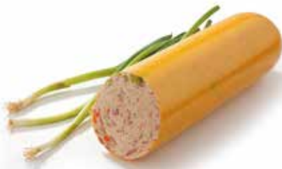
Saucisson 100% volaille aux légumes 100% gevogelte worst met groenten "100% geflügelwurst" mit Gemüse 100% poultry sausage with vegetables